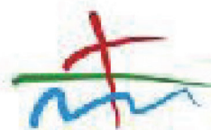
Logotip Općine Križ