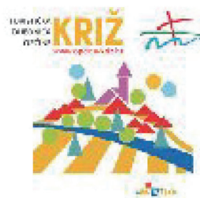
Logotip TZ Općine Križ

TZ Općine Križ i Općina Križ raspolažu logotipovima koji se najčešće koriste zajedno prilikom promocije događanja i manifestacija.